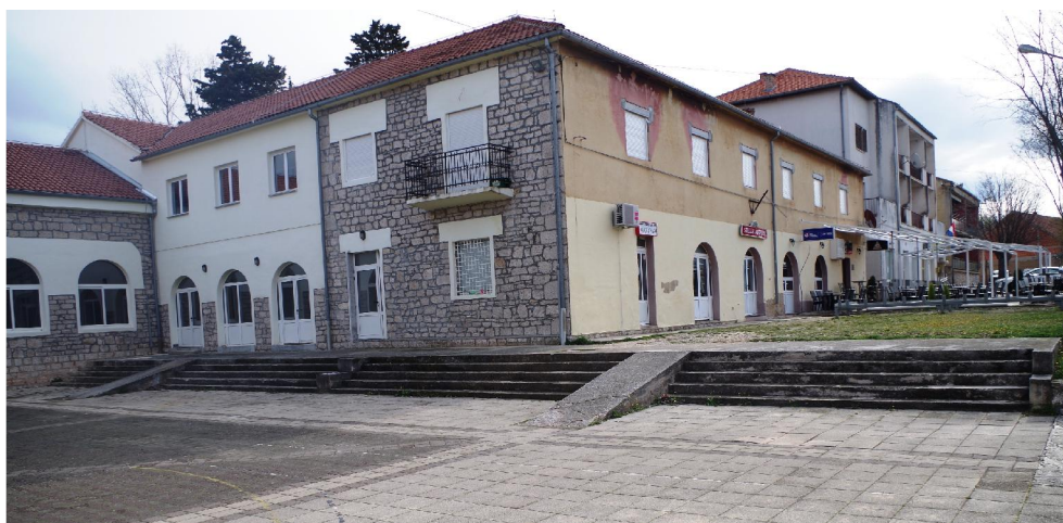
Slika 1. Pogled na stepenice