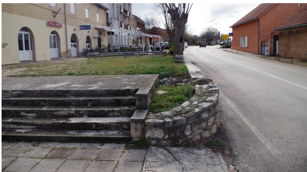
Slika 2. Pogled na ugao predmetnog zahvata