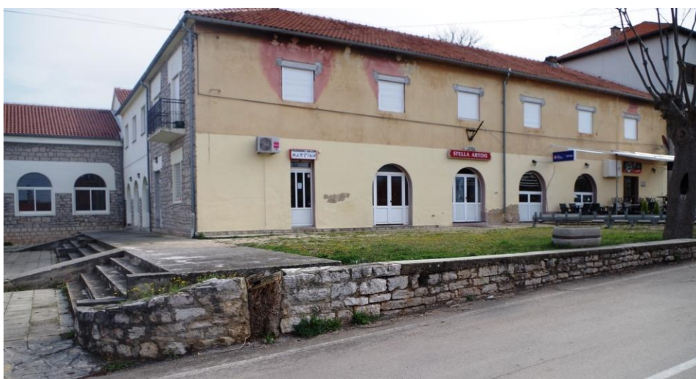
Slika 3. Pogled sa ulice na zid koji se sanira